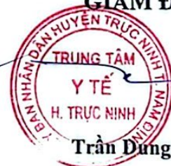
Trần Dung The