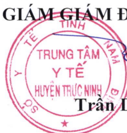
Trần Dung The